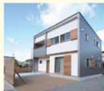
篠山市N様邸では外壁工事（ガルバリウム鋼板のサイディングの施工）をお世話になりました。

お祖父様が起こされた会社を三代目として継がれ、毎日が勉強と精進されている井本社長。そういう前向きに努力されている姿勢が、長く会社を存続させている秘訣のひとつではないでしょうか。また、社員の方たちと釣りに行かれたお話から、とてもアットホームでまとまりのある会社であることが伺えました。(T. KUROKI)